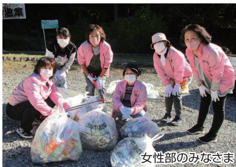
女性部のみなさま

11月16日、市内一斉清掃に合わせて、商工会役員、法人会役員の方々の協力を得て、女性部・青年部合同で、戸田峠、古宇方面のゴミ拾いを行いました。合計26名が参加しました。拾ったゴミは商工会に集められ、分別を行いました。集まったゴミの量は燃やすゴミ・缶・ビン合わせて47袋でした。