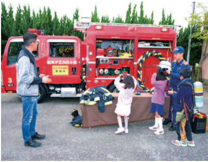
消防車の展示撮影ブース

11月12日、毎年恒例となり ました『はら逸品うまいもの フェス』を開催しました。地 元の「うまいもの」をたくさ んの方にアピールすることを 目指したイベントです。商工 会員のお店を中心に、合計25 店舗もの飲食店が軒を連ねま した。スポーツカーや消防車 の展示撮影会、静岡アイドル 「no Filter」のラ イブ、スマートフエンシング 体験会など昨年以上の盛り上 がりとなりました。雨天だっ た昨年とは打って変わり、気 持ちの良い秋晴れの中の開催 となり、たくさんのお客様に ご来場いただきました。