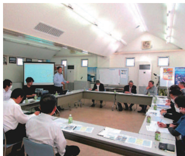
コンサルタントによる説明

海業についての説明から事例（千葉県鋸南町の漁協直営食堂のような大規模から和歌山県雑賀崎港の漁師直売、気仙沼港の施設見学ツアーなどの小規模）について説明があり、地元として何をやっていきたいかについて意見交換を行いました。