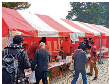
戸田支所青年部担当ガラガラ抽選会